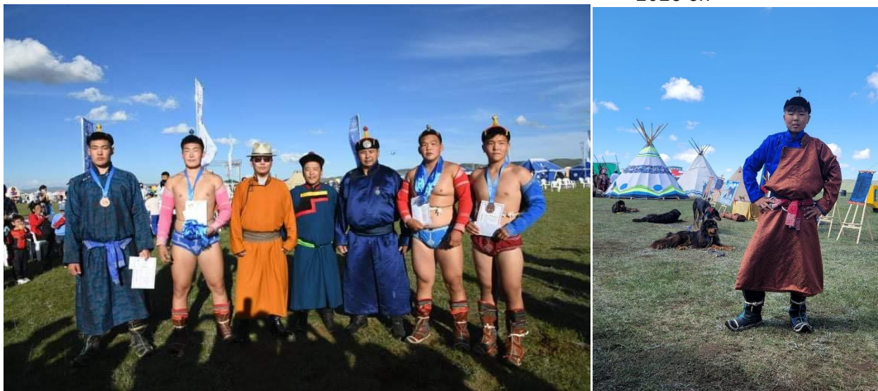
Зураг 60-63. “Нүүдэлчин” дэлхийн соёлын фестивалийн үеэр өсвөрийн бөхийн барилдаанд түрүүлж, амжилттай барилдсан бөхчүүдэд хүндэтгэл үзүүлсэн нь.