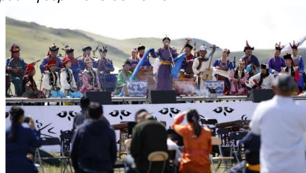
Зураг 13-14. Тайзны тоглолт /2023.08.18/