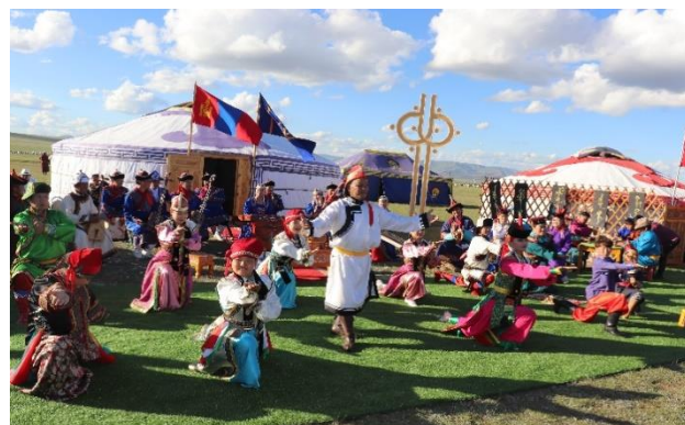
Зураг 11-12. Дархан-Уул аймгийн тайзны болон отгийн язгуур урлагийн үзүүлбэрийн үеэр /2023.08.18-20/