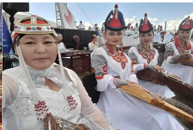
Зураг 58-59. “Сэрсэн тал” эгшиглүүлэхэд Дархан-Уул аймгаас оролцсон бүрэлдэхүүн