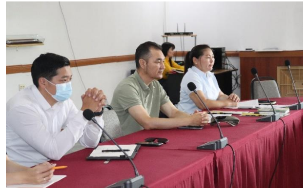
Зураг 3-6. Ажлын хэсгийн бүрэлдэхүүн хуралдсан нь. /2023.06.21, 2023.08.08/