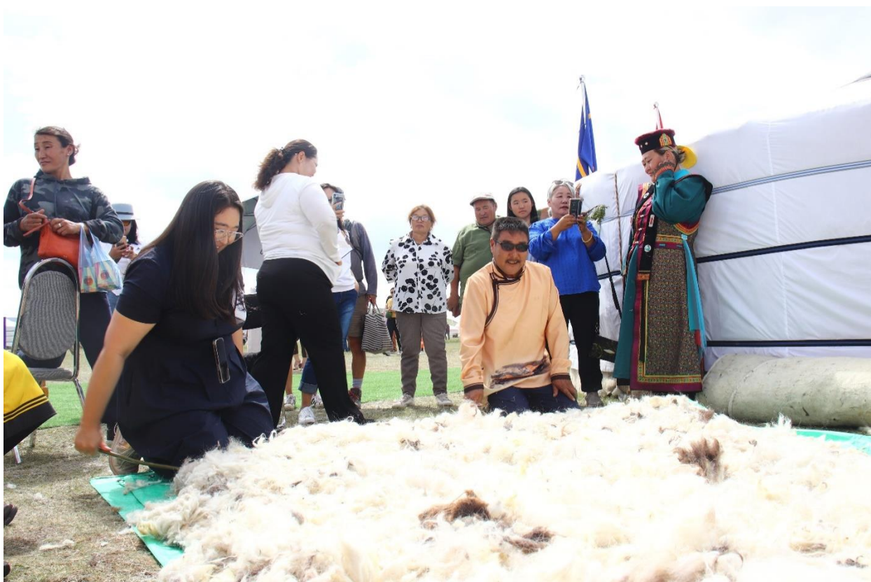
Зураг 57. “Нэхий” ХК монгол гэрийн цагаан эсгий дээврээр туслалцаа үзүүлж хамтран ажилласан нь.