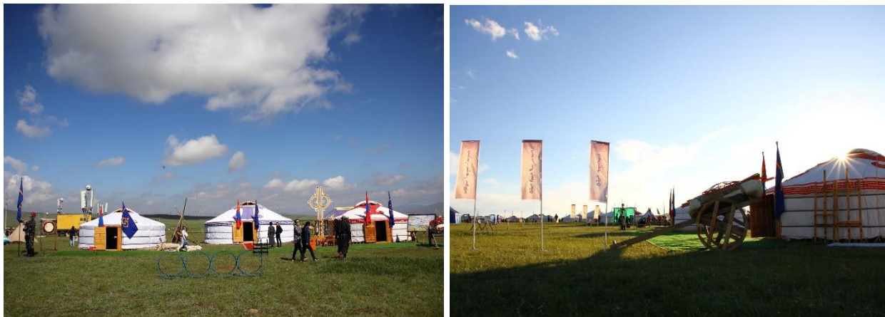
Зураг 7-8. Дархан-Уул аймгийн отгийн харагдах байдал

Дархан-Уул аймгаас 5 ай савын соёлын биет бус өвийн өвлөн уламжлагч 9, уламжлалт гар урлал ай савд соёлын биет бус өвийн өвлөн уламжлагч 6, соёлын бүтээлч үйлдвэрлэлийн асарт 4 оролцогч 11 байгууллагын 100 гаруй нэр төрлийн бараа бүтээгдэхүүнээр, удирдлага зохион байгуулалт 4 нийт 42 оролцогч, арын албаны зохион байгуулах 16 нийт 58 хүний бүрэлдэхүүнтэй оролцлоо.