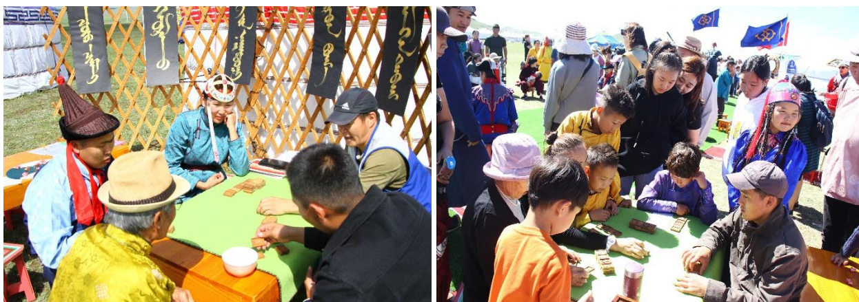
Зураг 64-65. Ардын уламжлалт тоглоом наадгайгаар наадуулсан нь.

Тус хөтөлбөрт Хорол, Чүү чамай, Тэмээн таваг, Дөрвөн бух, Шагайн наадгай зэрэг уламжлалт тоглоом найдгайг сурталчлан таниулах ажлыг зохион байгуулав. Наадмын 3 өдөрт 620 насанд хүрэгч, 980 хүүхэд нийт 1600 гаруй хүнд үйлчиллээ.