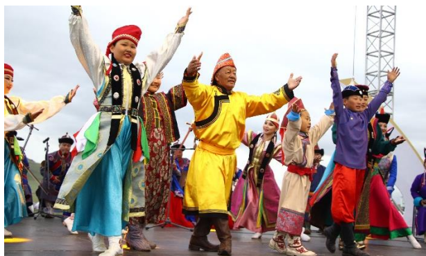
Зураг 15-16. Тайзны гала тоглолт /2023.08.20/