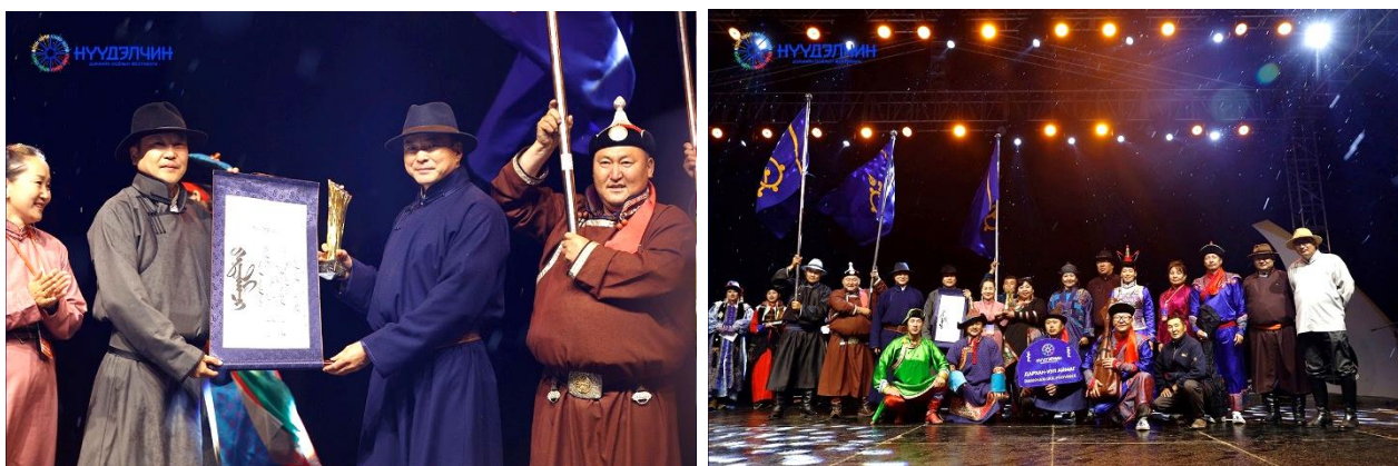
Зураг 9-10. Шагнал гардуулах ёслолын үеэр /2023.08.20 19.00 цаг/

Соёлын өвийн орон зай, бүтээлч үйлдвэрлэл, уламжлал шинэчлэл, баялаг байдал, соёлын биет бус өвийн олон төрөл зүйлийг түгээн дэлгэрүүлэх, илэрхийлэх хэлбэр, язгуур өв соёлоо дээдэлж, зохион байгуулалттай оролцсон, таниулан сурталчлахад амжилттай оролцсон “ ШИЛДЭГ 5 АЙМГИЙН НЭГ ”-ээр шалгарч, цом батламж гардан авлаа.