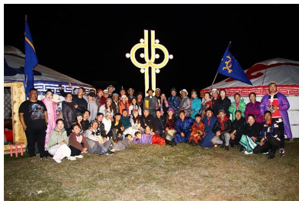
Зураг 1-2. “Нүүдэлчин” дэлхийн соёлын фестивальд Дархан-Уул аймгаас оролцсон бүрэлдэхүүн /2023.08.16-21/