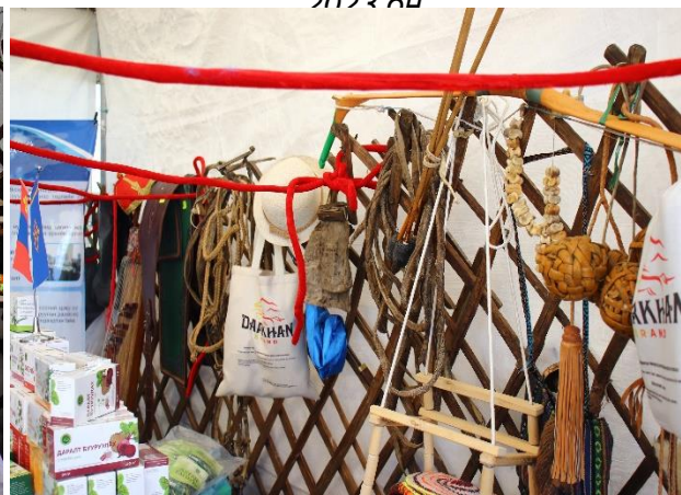
Зураг 51-56. Соёлын бүтээлч үйлдвэрлэл эрхлэгчид бүтээгдэхүүнээрээ оролцсон нь.