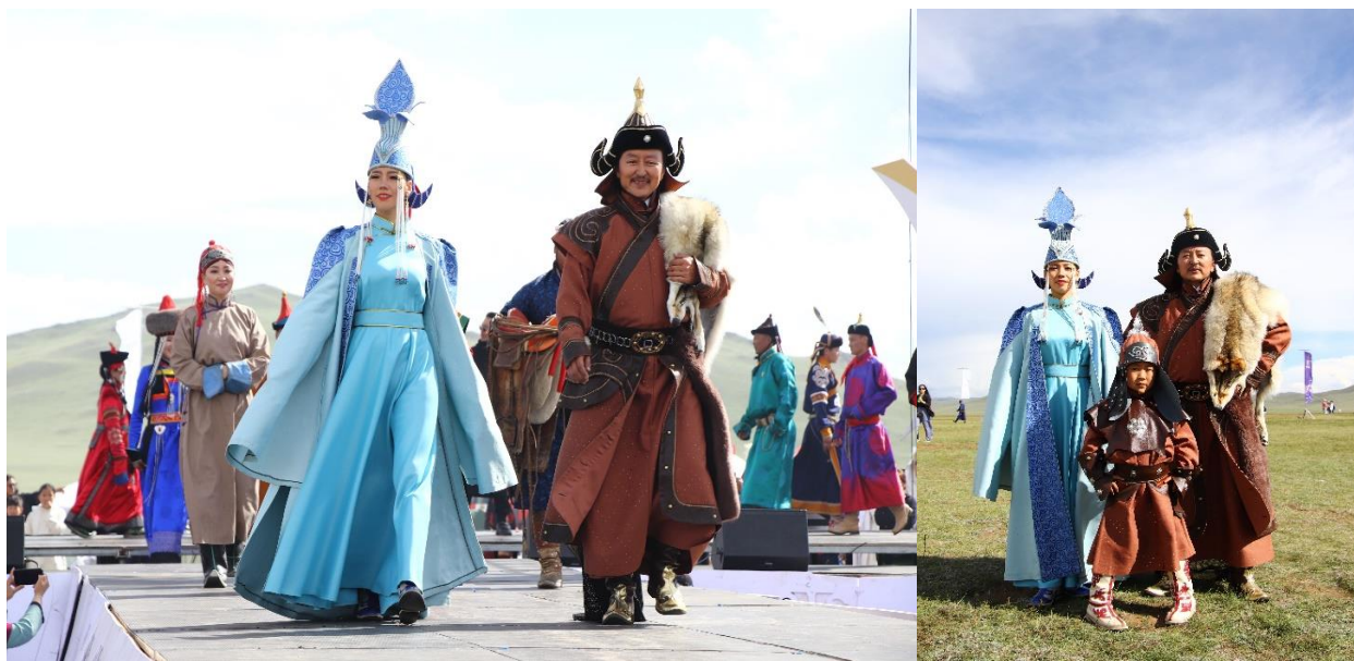
Зураг 66-67. Үндэсний хувцасны үзүүлэх тоглолтын үеэр.