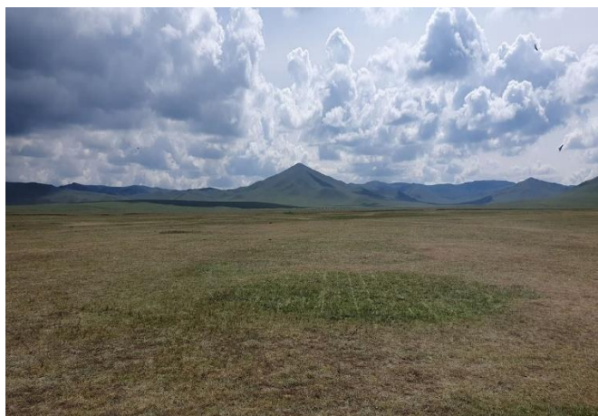
Зураг 73-74. “Нүүдэлчин” дэлхийн соёлын фестиваль зохион байгуулагдсан газарт байрласан отгийн гадна орчныг цэвэрлэж, гэр, эд зүйлсээ ачиж байгаа нь. /2023.08.21/