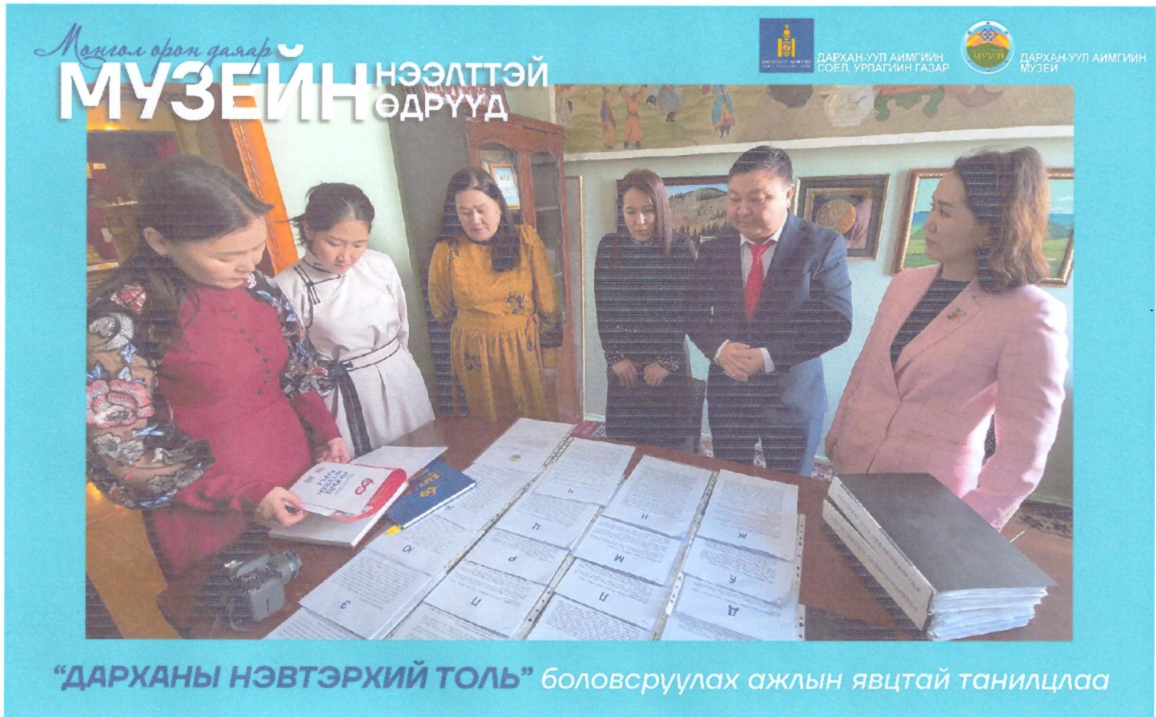
“ДАРХАНЫ НЭВТЭРХИЙ ТОЛЬ” боловсруулах ажлын явцтай танилцлаа

Мөн “Эх орныхоо өв соёлыг түгээн дэлгэрүүлэх, бахархах, үндэсний нэгдмэл үнэт зүйлийг бэхжүүлэх” зорилготой “ИЛГЭЭЛТИЙН ЭЗЭД” төслийн хүрээнд хуучны шашин, угсаатны эд зүйл, хуучны тоглоом, гитар, сурагчийн форм, гэр ахуйн эд зүйлс, тоног төхөөрөмж зэргийг Музейд хадгалуулснаар илүү үнэ цэнэтэй, үеийн үед таны нэрээр дуурсагдан хадгалагдаж, өнө удаан жил хойч үед өвлөгдөн, сурталчилагдах, тодорхой шалгуураар, шаардлага хангасан эд зүйлсийг журмын дагуу үнэ тохирч худалдан авах тухай уриалгыг олон нийтэд нийтэлсэн. Илгээлтийн эзэд булантай танилцлаа.