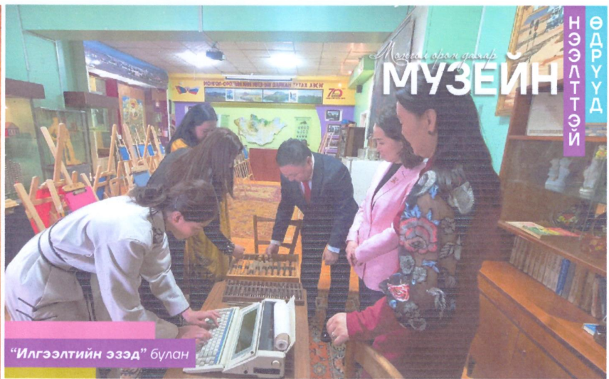
“Илгээлтийн эзэд” булан

Монгол Улсын Засгийн газрын гишүүн, Соёлын Сайд болон Дархан-Уул аймгийн Засаг дарга нарын 2023 ОНД ХАМТРАН АЖИЛЛАХ ГЭРЭЭ-ний 4.7 дахь заалт, дөрөвдүгээр хавсралтын 4.20 дахь заалт, зургаадугаар хавсралтад тусгагдсан “МУЗЕЙ, НОМЫН САНГИЙН ЦОГЦОЛБОР”-ын барилгыг улсын болон орон нутгийн хөрөнгө оруулалтаар хийж гүйцэтгэх ажил 30 гаруй хувьтай явагдаж байна.