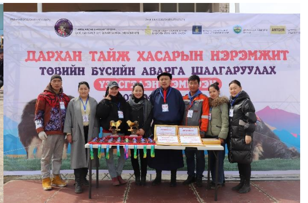
ДАРХАН-УУЛ АЙМГИЙН СОЁЛ, УРЛАГИЙН ГАЗАР