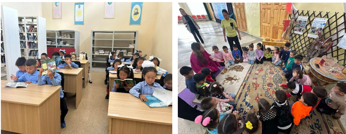
Зураг 6. Орхон сумын соёлын төв нь тус өдрийн хүрээнд сумын хүүхэд, багачуудад “Амттай уншлага”, “Уламжлалт тоглоом наадгай” боловсролын хөтөлбөрөөр үйлчлэв.