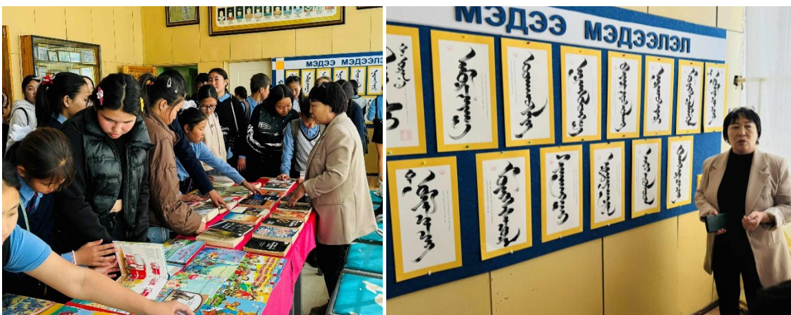
Зураг 8. Хонгор сумын соёлын төв нь тус өдрөөр хүүхдийн уран зохиолын номын, бийрэн бичлэгийн үзэсгэлэн гаргаж 51 хүүхэд үзэж сонирхсон.