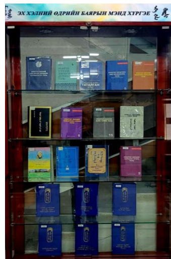
Зураг 3. Хүүхдийн номын ордон 4 дүгээр сургуулийн номын санчийн урилгаар эх хэл, түүх соёл, үндэсний бичгээр хэвлэгдсэн номоор үзэсгэлэн гаргалаа. Мөн ордонд тус өдрөөр сэдэвчилсэн номын үзэсгэлэнг зохион байгуулж 96 хүнийг хамруулжээ.