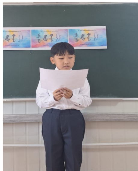
Зураг 4. Хүүхдийн номын тус өдрийн хүрээнд “Эх хэл бидний бахархал” шүлгийн уралдааныг зохион байгуулж 32 хүүхдийг хамруулсан.