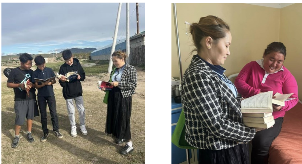
Зураг 7. Орхон сумын соёлын төв нь сумын иргэд, уншигчдад зөөврийн номын сангийн үйлчилгээгээр үйлчиллээ.