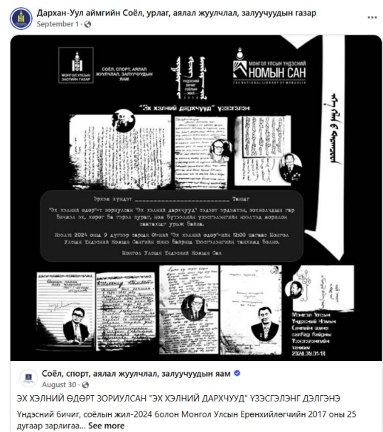
Зураг 1. Аймгийн соёл, урлаг, аялал жуулчлал, залуучуудын газар нь ту өдрийн хүрээнд мэндчилгээ дэвшүүлж зураг хуудас бэлтгэж яам, агентлагаас гаргасан сурталчилгаа цахим шэйрлэн, харьяа соёлын байгууллагуудад тус өдрийг тэмдэглэн өнгөрүүлэх тухай чиглэлийг хүргүүлсэн. /2024.09.01/